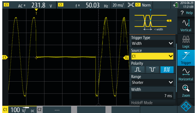
宽度触发等专用触发功能可以隔离供电电压下降等无用事件

使用记录器模式可以有效地监控电压变化。支持记录最多四个测量值，长达 23 天的自动记录结果。可以轻松记录电压、频率或任何其他相关测量值在每小时、每天或每周的变化。